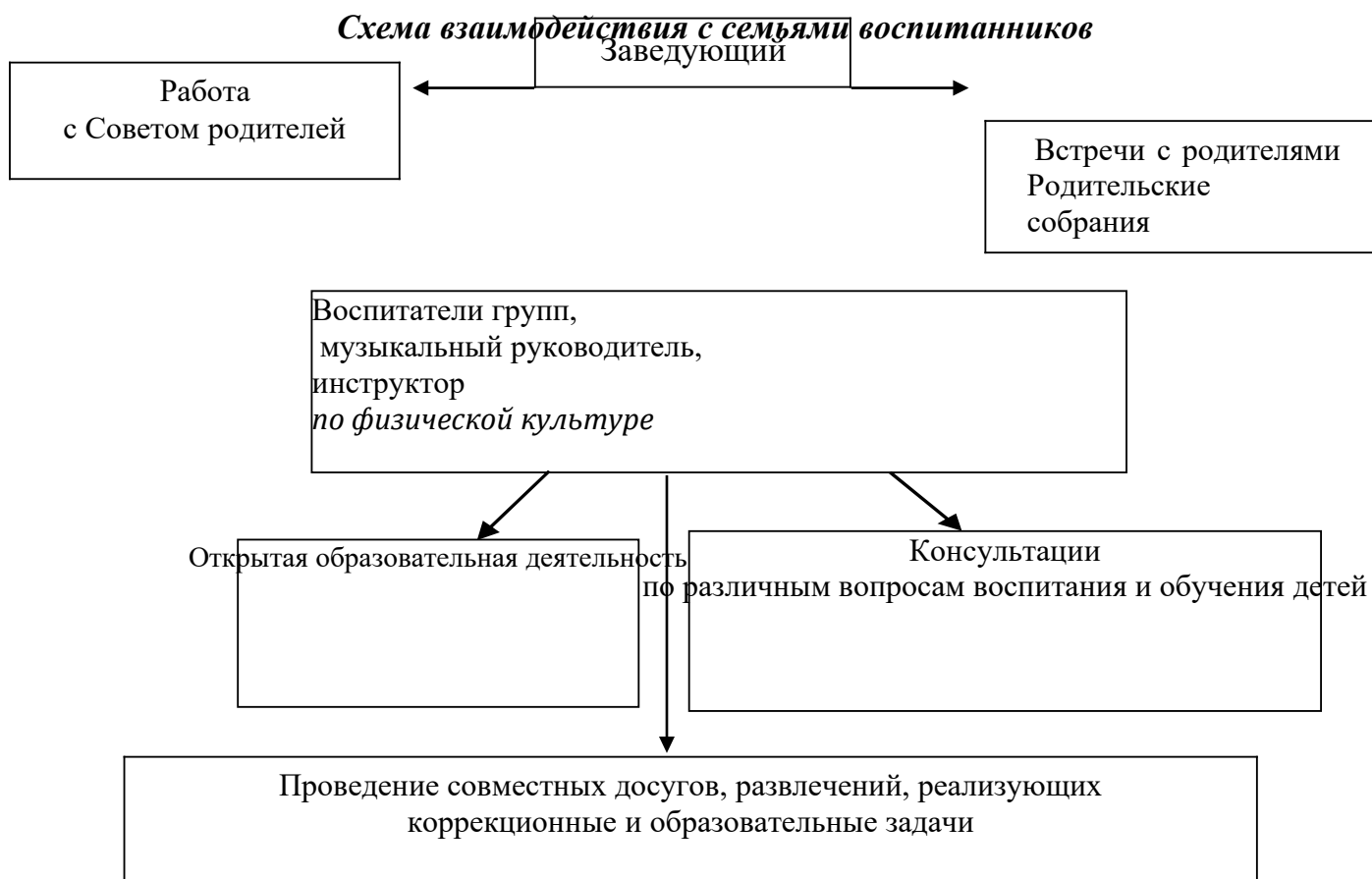
Рис. 1 «Схема взаимодействия с семьями воспитанников»